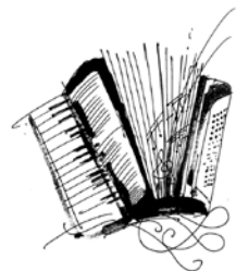
EIŠIŠKIŲ MUZIKOS MOKYKLA

Baigė Eišiškių muzikos mokyklą. Nuo 1998 m. dirba Eišiškių muzikos mokyklos akordeono mokytoja. Jos mokiniai kasmet dalyvauja konkursuose, festivaliuose, koncertuose. Yra parengusi konkursų diplomantų ir laureatų.