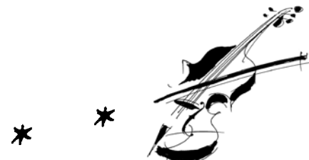
UKMERGĖS MUZIKOS MOKYKLA