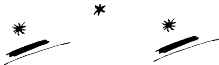
TRAKŲ MENO MOKYKLA

1990 m. baigė Lietuvos muzikos ir teatro akademiją, įgydamas trimitininko specialybę. Dirbdamas Trakų meno mokykloje paruošė nemažai šio instrumento atlikėjų. Jo iniciatyva rengiamos „Trakų fanfarinės savaitės“, kuriose patirties semiasi jaunieji pučiamųjų instrumentų atlikėjai. Tai svarbūs meistriško kursai, peržengiantys regiono ribas. Įkūrė ir vadovauja fanfarų orkestrui „Trakai“, kuris yra pelnęs aukštų įvertinimų Lietuvos orkestrų konkursuose.